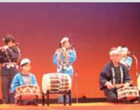
▲打囃子保存会による演奏 (H23年度文化団体連盟祭)