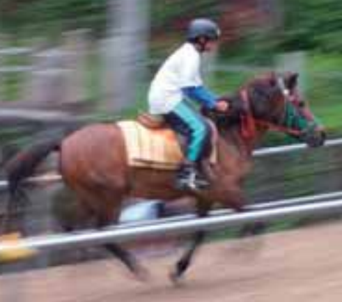
▲八幡神社の人気者「秀三」も頑張っています！