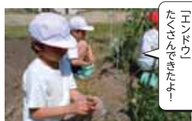
あおぞら・みどり「野菜の栽培」