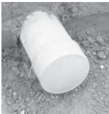
▲取付管にキャップをして閉栓

下水道に接続されていた建物を壊すなど、下水道を使用しなくなる場合は、取付管に雨水や土砂が入らないように閉栓し、下水道に接続する前と同じ状態にして、下水道課に「廃止届」を提出してください。その際、閉栓が確認できる写真の提出をお願いします。