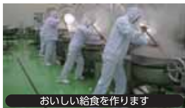
おいしい給食を作ります

9月の給食では… 土岐市産の玉ネギ、赤玉ネギ、ジャガイモ、小松菜を使用する予定です。