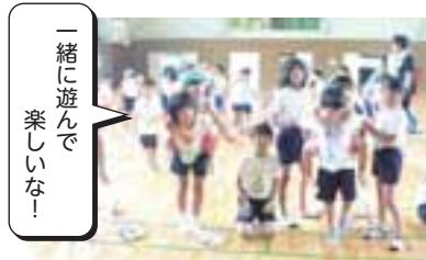
4年生「泉西幼稚園との交流」