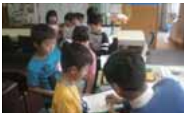
1年生「がっこうたんけん」