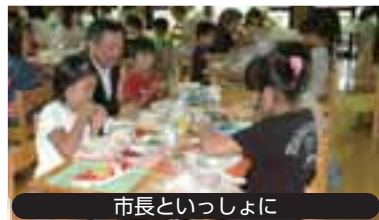
市長といっしょに