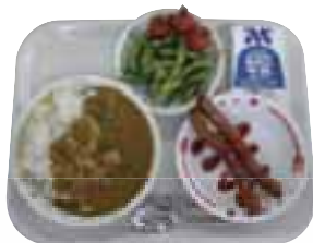
夏野菜カレーを中心にしたメニュー