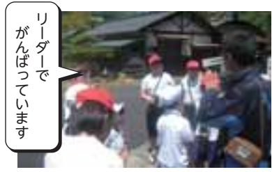
6年生「西っ子オリエンテーリング」

人や自然と触れ合う活動、地域から校区の素晴らしさを学ぶ活動、さらに「掃除」「授業」「合唱」など日頃の学校生活から、子どもたちの「美しい心」の高まりを期待しています。