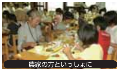
農家の方といっしょに

9月の給食では… 土岐市産の玉ネギ、赤玉ネギ、ジャガイモ、小松菜を使用する予定です。