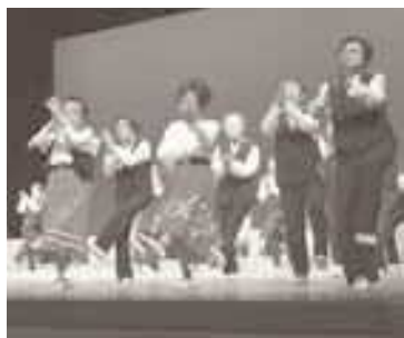
▲クラブ発表会の様子