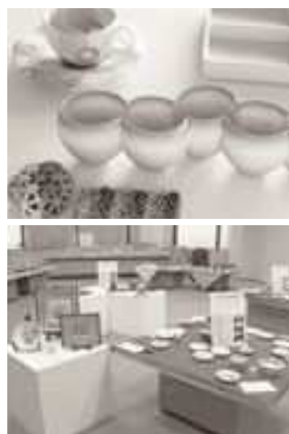
〈昨年度の展示より〉