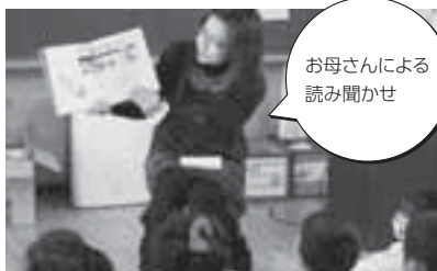
お母さんによる 読み聞かせ