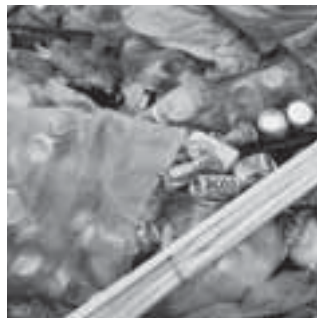
▲不燃ごみで出された空き缶

源となる物が多く入っています。可燃ごみでは約30%が紙や布であり、資源として扱うことができます。不燃ごみは現在再分別をし、1月当たり空き缶類を約2300kg取り出し資源化しました。またその中には、可燃ごみの混入も多く2800kgを最終処分場に埋め立てるのではなく、焼却処分になりました。