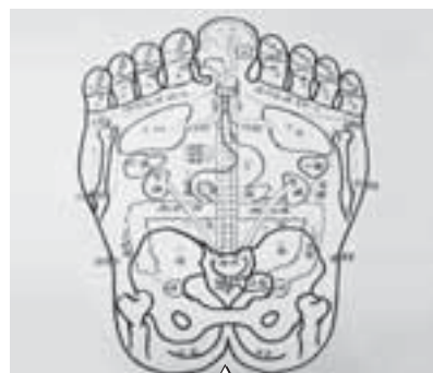
「足裏つぼ」の資料を参考に、 熱心に指導を受けました

保育参加日に、親子のスキンシップや健康づくりを目的とした「親子ふれあい足もみ教室」を受講しました。基本は「温かく柔らかい体」づくり。体を温め、血液・リンパの流れを活性化します。触れてあげることによって子どもも心が安らぎ、元気が出ます。「第二の心臓」といわれる足をはじめ、手や顔にもさまざまなつぼがあることを知りました。