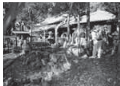
▲駄知さわやかウォーキングで旧カクサ邸に立ち寄る参加者

（財）地域活性化センターからの宝くじ助成を受けて、駄知町地域産業活性化委員会は、昨年「だち窯風の里交遊フェア」と題し、旧カクサ邸のライトアップ、JR東海とタイアップした駄知さわやかウォーキング、おから様散策路での記念植樹などを実施しました。