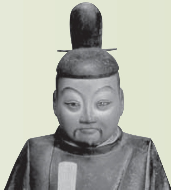
古田織部像／藪内佐斗司