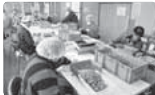
▲ドリームプラザの様子。車の部品の組み立てや箱折りなどの仕事を行っています。