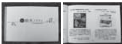
手作り冊子「絵本ノススメ」 絵本紹介の1ページ

子どもたちが絵本により親しめるよう絵本紹介の冊子を作成し、各家庭に配布しました。保護者と園職員が文章を寄せ、お薦めの絵本を紹介することで、それぞれの家庭の「絵本体験」が分かち合え、新たな絵本との出会いにつながりました。