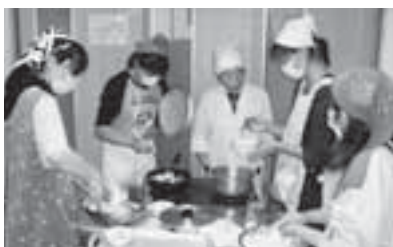
調理実習(妻木公民館にて)