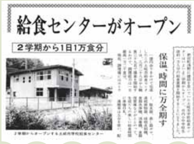
▲旧・給食センターのオープンを伝える 当時の広報とき(昭和47年8月10日号)

0食を調理しました。しかし、子どもの減少に伴い調理数は減少し、今では1日6千食となっております。 昨年12月24日、旧・学校給食センターは最後の給食を中学校に届け、その役目を終えました。