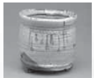
▲志野水指(福岡市美術館)