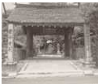
崇禅寺 ▲総門 ▼唐門