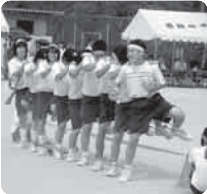
体育祭での3年生のむかでリレー

西陵中学校では、学校行事や生徒会活動を通して、生徒たちが社会性を身に付けるようにしています。 前期メイン行事の体育祭では、生徒たちは紅白の団に分かれ、応援や競技を行う中で、上級生が下級生に働き掛けたり、仲間とともに頑張る中で仲間とのきずなを強め、学級の和や学年を超えての交流ができました。 後期の大きな行事は合唱祭です。学級・学年の仲間が真剣に声を出し合い、全員の声が響き合ったときの充実感、仲間と一緒に取り組んできた喜びを覚えます。 今年の合唱祭は1月に予定しています。合唱活動は、4月の新入生歓迎会より在校生が体育館に響く歌声で新入生を迎え入れ、合唱の素晴らしさを伝え「西陵中の伝統」として