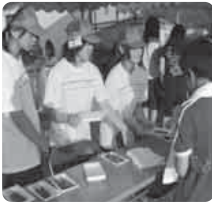
妻木町夏祭りでのボランティア活動

『地域社会の中で』…西陵中学校では、生徒たちが地域のさまざまな行事にボランティアとして参加し、社会貢献に努めています。妻木町・下石町の町民運動会、夏祭り、文化祭、またウエルフェア土岐での福祉活動など。昨年は112人がボランティア登録し、延べ196人の生徒たちが自主的に地域に出掛け、地域の方たちと一緒に活動盛り上げました。 今年度も多くの生徒たちが地域ボランティアに参加し、地域の方からも、こうした西陵中の生徒の活動は大変歓迎されています。