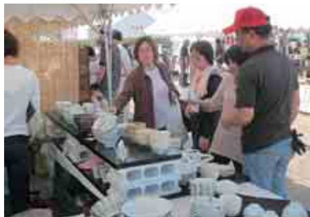
下石どえらあええ陶器祭り