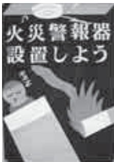
各務友一朗さんの作品