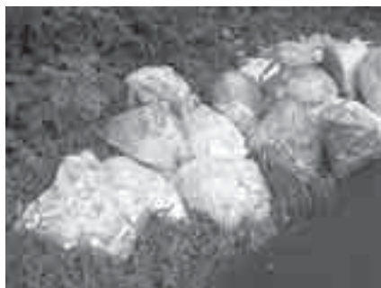
▲回収された不法投棄ゴミ