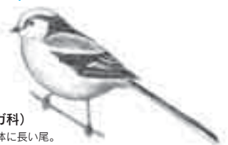
エナガ(エナガ科) 白っぽい小さな体に長い尾。 秋冬はシジュウカラ科の鳥と群れる。「チー」という細い声はシジュウカラ科に似ているが、「ツリユリユ」という声は独特。

●お願い 陶史の森は、動植物を保護しています。山野草やミズゴケなどを絶対に採らないでください。また、陶史の森およびせらぎ公園へのペットの立ち入りはご遠慮ください。