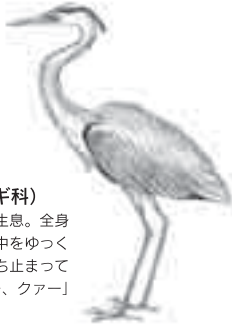
アオサギ (コウノトリ目/サギ科) 川、池沼、水田などに生息。全身灰色の大きな鳥。水の中をゆったり歩いたり、じっと立ち止まって魚を捕まえる。「クアー、クアー」と大声で鳴く。

お願い 陶史の森は、動植物を保護しています。山野草やミズゴケなどは絶対に採らないでください。また、陶史の森およびせせらぎ公園へのペットの立ち入りはご遠慮ください。