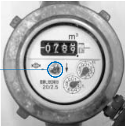
パイロットマーク

点検の方法は簡単です。家中の水道の蛇口を閉め、メーターのパイロット(銀色のコマ・写真参照)を見ます。少しでもパイロットが回っている場合は漏水の疑いがありますので、速やかに市水道工事指定店に修理を依頼してください。