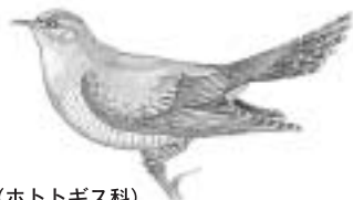
ホトトギス(ホトトギス科) とがった翼に長い尾。夏鳥。大きな毛虫を好む。主として、ウグイスに托卵(巣を作らず、ほかの鳥の巣に卵を産み育てさせる)。飛びながらよく鳴く。

★陶史の森の催しは、お一人でも参加できます。ただし、低学年児童は、親子でご参加ください。