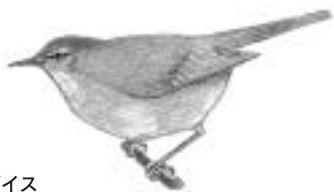
ウグイス 低いやぶの中で「チャツチャツ」と鳴く(地鳴き)。全国で繁殖。灰色つばい黄緑褐色。「ホーホケキヨ」または「ケキヨケキヨ」を繰り返して鳴く。当所での初鳴きは3月9日(月)でした。

お願い 陶史の森は、動植物を保護しています。山野草やミズケなどを絶対に採らないください。また、陶史の森およびせせらぎ公園へのペットの立ち入りはご遠慮ください。