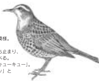
ツグミ まゆぶち、胸にまだら模様。 秋に飛来。 小走りに移動しては立ち止まり、地上の虫やミミズを食べる。 鳴き声は「クィクィ、キューキュー」。 驚くと「キョキョキョ」とけたたましく鳴く。

●お願い 陶史の森は、動植物を保護しています。山野草やミズゴケなどを絶対に採らないでください。また、陶史の森およびせせらぎ公園へのペットの立ち入りはご遠慮ください。