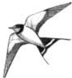
ツバメ 夏鳥。赤褐色ののど。人家に深いおわん形の巣をかける。主に空中で生活し、飛びながら虫を捕る。

お願い 陶史の森は、動植物を保護しています。山野草やミズゴケなどを絶対に採らないでください。また、陶史の森およびせせらぎ公園へのペットの立ち入りはご遠慮ください。