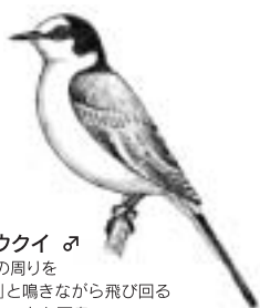
サンショウクイ ♂ 高いこずえの周りを「ヒリヒリン」と鳴きながら飛び回る白っぽいスマートな夏鳥。

お願い 陶史の森は、動植物を保護しています。山野草やミズケなどを絶対に採らないでください。また、陶史の森およびせらぎ公園へのペットの立ち入りはご遠慮ください。