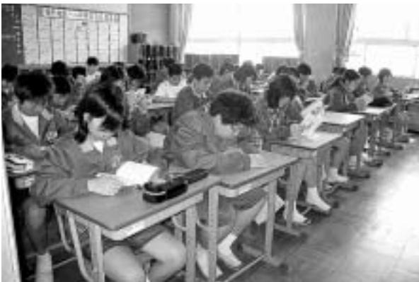
朝の読書の様子(1年生)

『今年度から始まった「朝の読書」は、とても充実した時間になっていると思います。全校で静かに本を読む時間があるのは、とてもうれしいです』