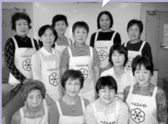
今年度の役員さんです