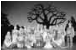
前回公演より