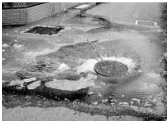
汚水があふれ出ている様子

先日、下水道管が詰まって汚水があふれ出るといふ事故が起きました。調査の結果、衣類・タオル・紙おむつ・生理用品・ビニール製品などが管の中から発見されました。水に溶けない物は絶対に流さないでください。