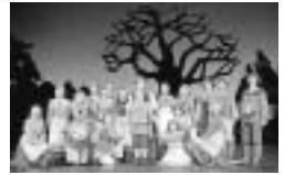
前回公演より

「わたしは魔女のマジョリン。年は123才、でも魔女の世界ではまだ小学生なの。。。」元気いっぱい、好奇心旺盛なマジョリンとユニークな魔女たちの冒険が、舞台いっぱいに繰り広げられます。夢いっぱいの魔法の世界を、ご家族全員でお楽しみください！