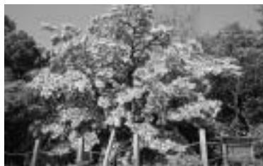
白山神社(泉町)のヒトツバタゴ