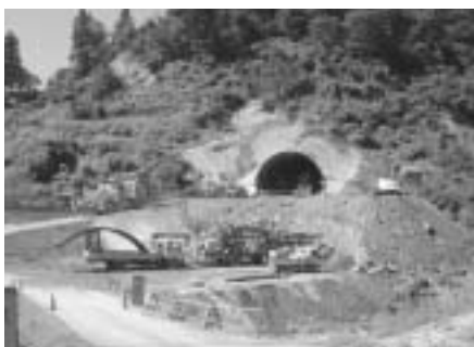
トンネル工事の様子

に進みません。 工事の発注に向けて、今後も作業を続けていきます。 (九月八日執筆)