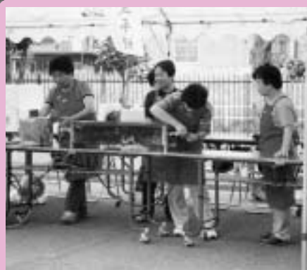
第7回土岐市ホタルまつり&下水道まつり（平成13年） ミニコンサートや、婦人会による五平餅などの有料販売を始めました。