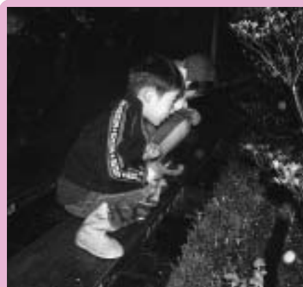
4月のホタル上陸観察会