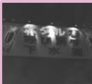
管理本館に設置した看板