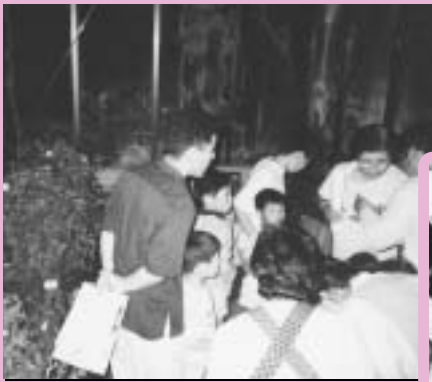
第1回ホタル鑑賞の夕べ（平成7年） 鑑賞会のみでした。

下水道の必要性や環境保全の大切さを、市民の皆さんに理解していただこうと、平成7年から市浄化センターを会場に、毎年開催しています。