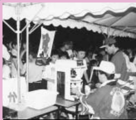
第2回ホタル鑑賞の夕べ（平成8年） 縁日広場を開催しました。