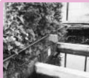
完成した屋外飼育水路内部の様子