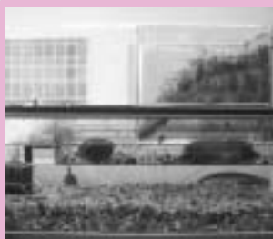
上陸棚をセットした室内飼育装置