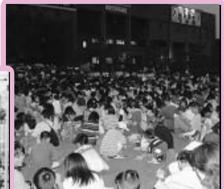
第8回土岐市ホタルまつり&下水道まつり（平成14年） ビンゴ大会には、多くの市民が参加しました。