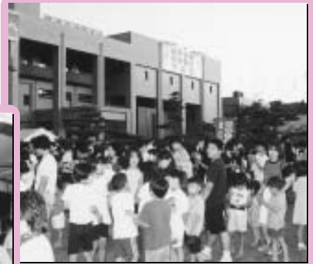
第3回ホタル鑑賞の夕べ（平成9年） 多くの市民に楽しんでもらえるイベントになりました。