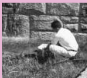
幼虫を陶史の森へ放流したときの様子