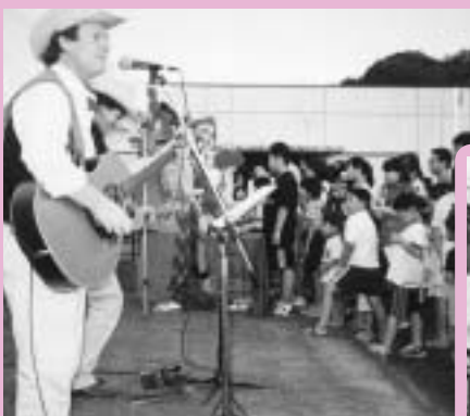
第4回ホタル鑑賞の夕べ（平成10年） 演奏会も開催し、楽しいイベントを目指しました。