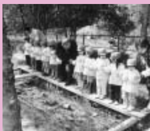
せせらぎ水路完成式の様子