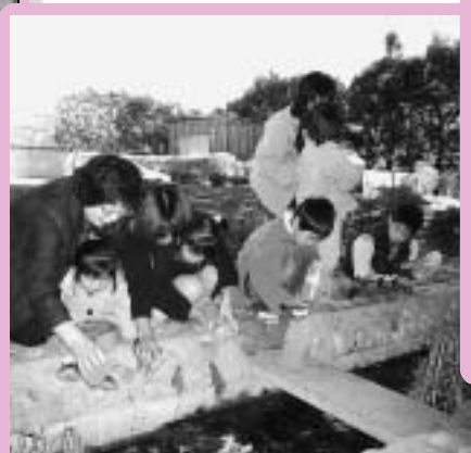
掘り出した幼虫をせせらぎ水路に放流