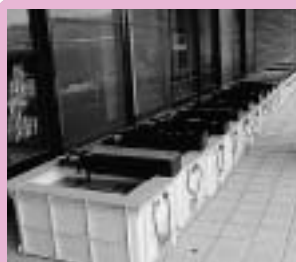
ベランダに置かれた飼育用のコンテナ