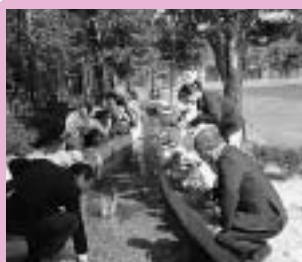
新せせらぎ水路完成式の様子