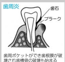
歯周ポケットができ歯根膜が破壊され歯槽骨の破壊も始まる