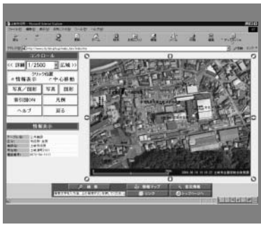
公共施設マップの市役所周辺

登録は市ホームページの「情報提供サービス」または携帯電話用アドレス「 http://www.city.toki.gifu.jp/mtcs/index.html 」からどうぞ。