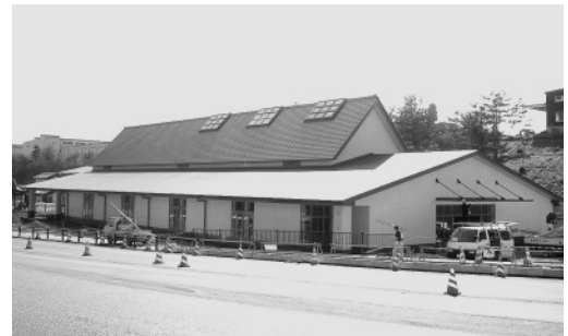
地域振興施設「陶遊館」