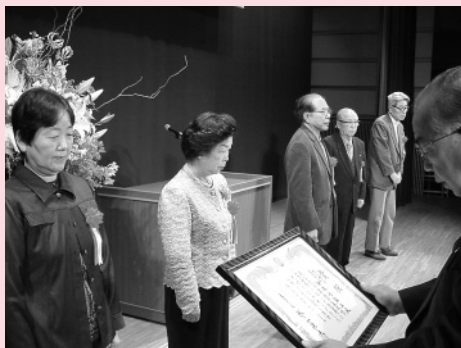
第2回土岐市文芸祭 応募点数・上位入賞者内訳(敬称略)

(各部門上位入賞者名、応募数などは別表の通り) なお、入選以上の作品を収めた作品集を発行しました。販売価格は、一冊五百円です。 ご希望の方は、文化振興課(内線555)へお問い合わせください。 詳しくは、同課へどうぞ。