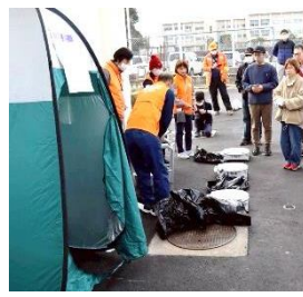
非常トイレ設営訓練