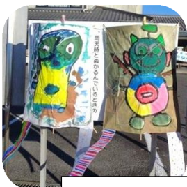
作って遊ぼう!弓・凧作り大作戦