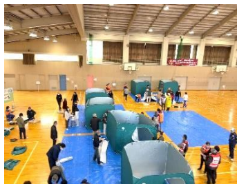
避難スペース設営訓練