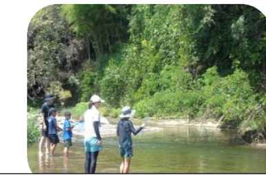
肥田川で生き物探索体験 × 肥田川の化石を採取しよう