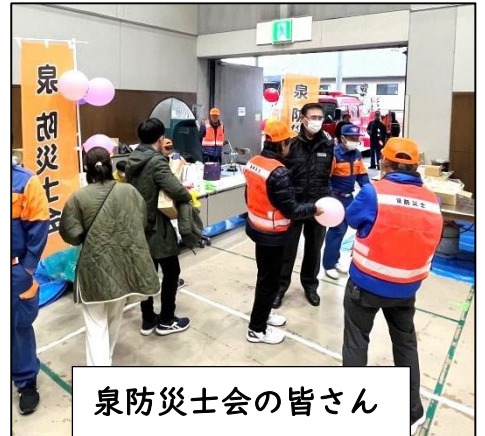
泉防災士会の皆さん