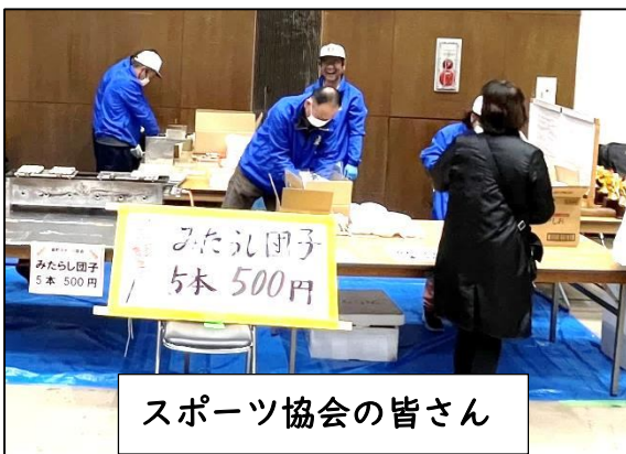
スポーツ協会の皆さん