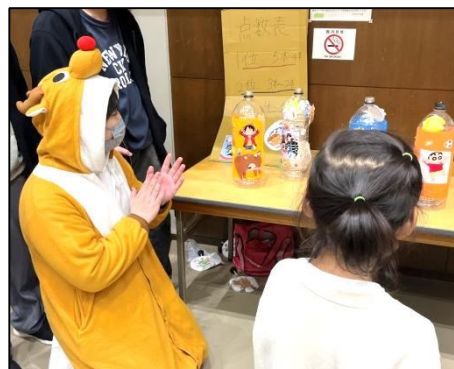
織部高等学校 着ぐるみ 😊