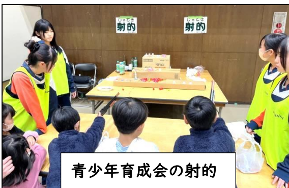
青少年育成会の射的