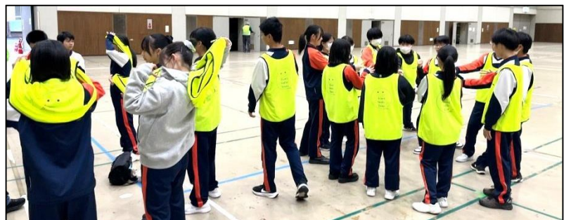
泉中学校の皆さん、ボランティアお疲れ様でした！

町民の皆さま、泉町各種団体の皆さま ご来場そして多大なるご協力、誠に ありがとうございました。