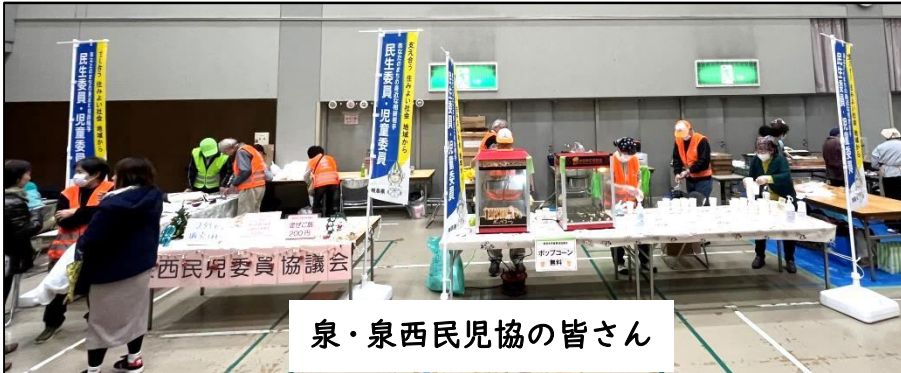
泉・泉西民児協の皆さん