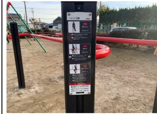
複合健康遊具 ※垂直はしご+棒とびこし+平行棒