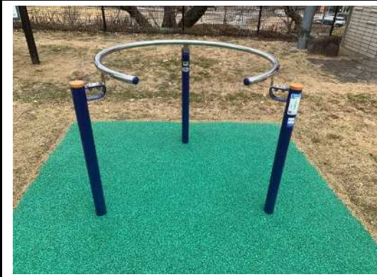
ツイストサークル