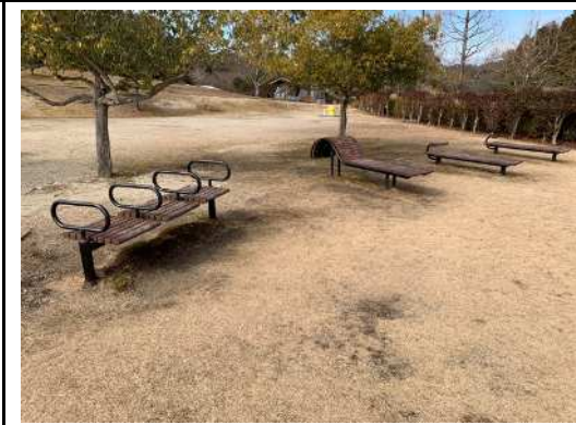
あん馬ベンチ、背のぼしベンチ、 腹筋ベンチ