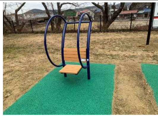
ベンチストレッチ