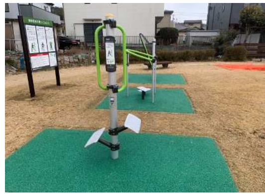
ふみいたストレッチ