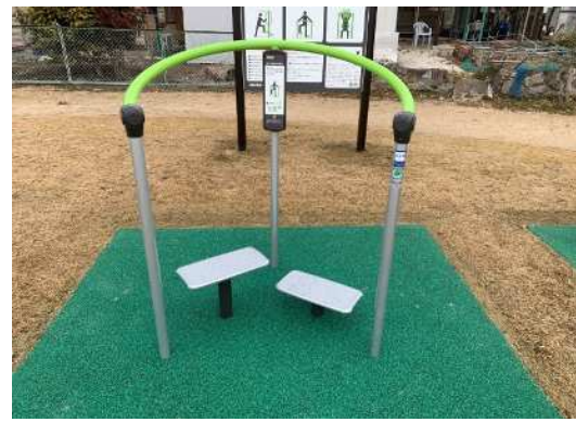
ダブル踏み台昇降