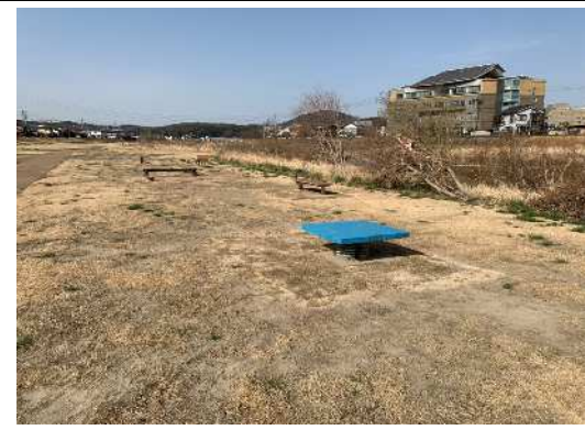
踏み台昇降、上体そらし、平均台、腹筋台、スプリングデッキ