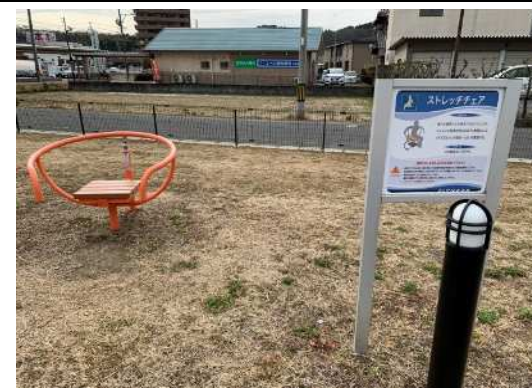
ストレッチチェア