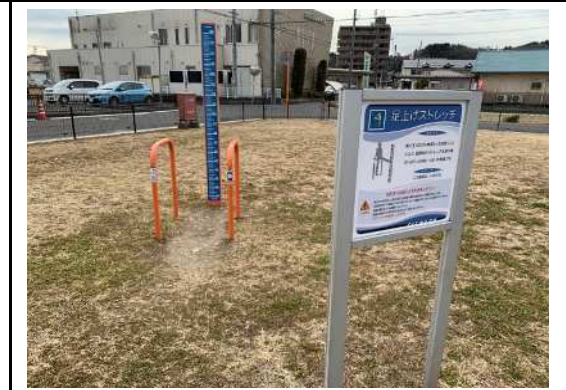
足上げストレッチ