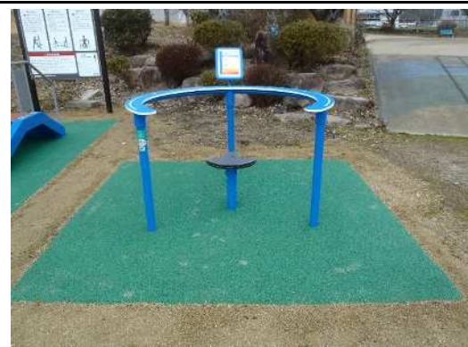
ツイストサークル