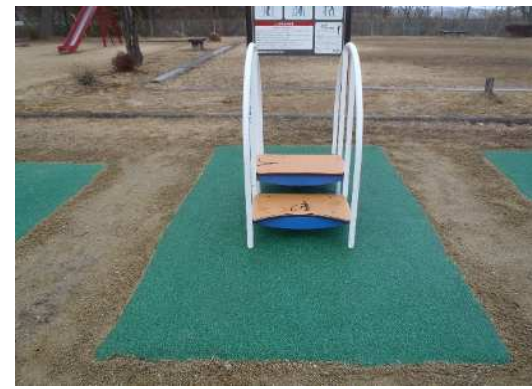
ユッタリステップ