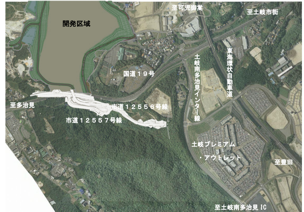
土岐口開発に伴う周辺道路新設 イメージ図