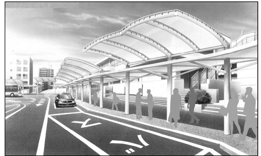
駅前広場整備 イメージ図