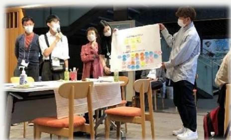
市民ワークショップの様子