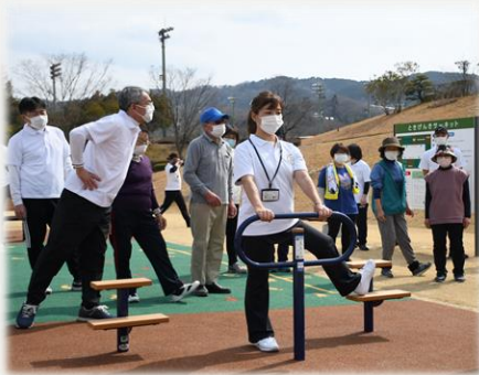
公園に設置している健康遊具

子どもから高齢者まですべての世代が健康で元気に活躍できるまちを目指し、全世代健康寿命延伸事業「ときげんきプロジェクト」を推進しています。