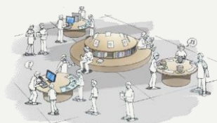
新博物館イメージ

土岐市が有する文化財の保存・活用に加えて、周辺史跡の活用や、市域全体のにぎわい創出等につながる活動として、「美濃焼」と「土岐市の歴史・文化」をテーマとした新博物館の建設事業に取り組んでいます。