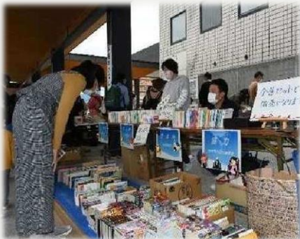
ブックフェス（古本市）の様子