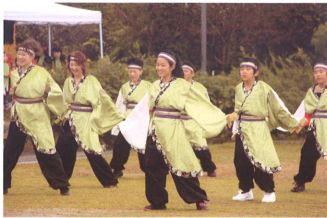
戦国バサラ 大人チーム