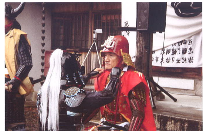
出陣式の様子 (南宮神社)