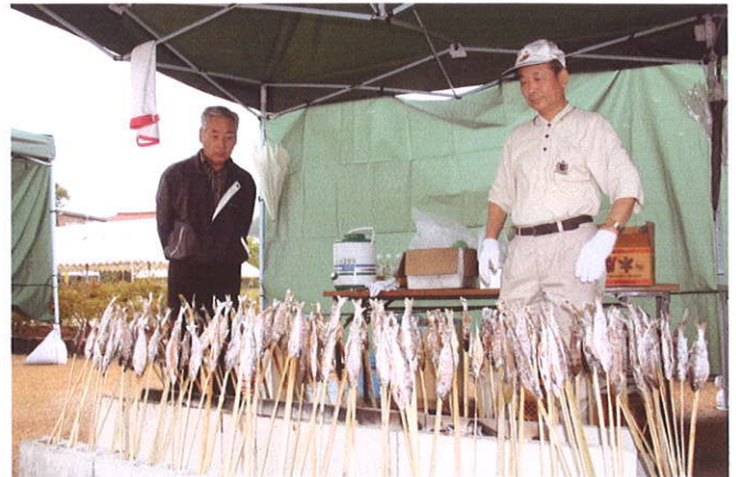
アマゴの串焼きも完成！