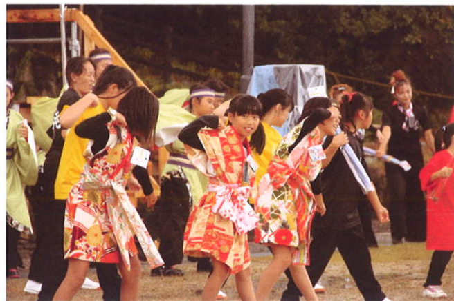
戦国バサラ 子供たちが大活躍