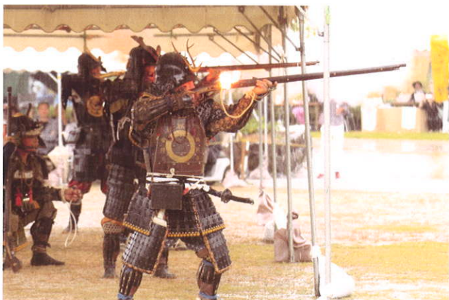
火縄銃の実演 長篠・設楽原鉄砲隊