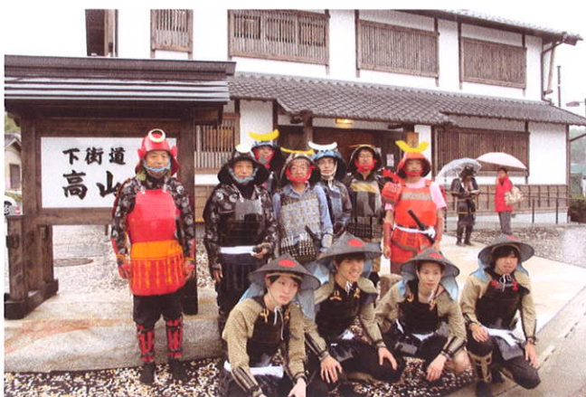
高山城戦国武将隊