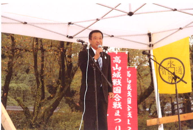
加藤靖也 市長のごあいさつ