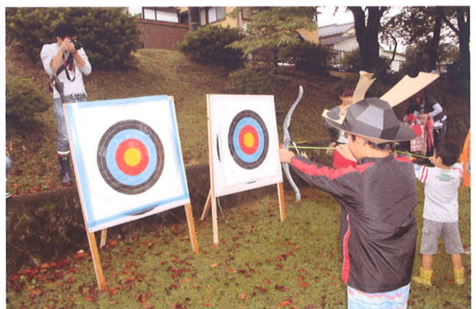
真剣に的当てに取り組む子供たち