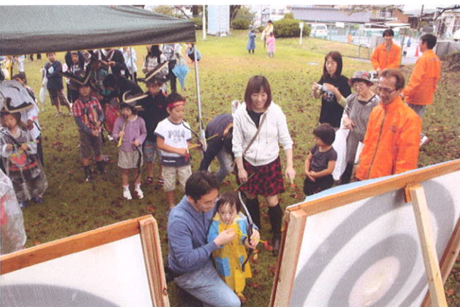
高山公園では子供たちの的当て大会が行われた