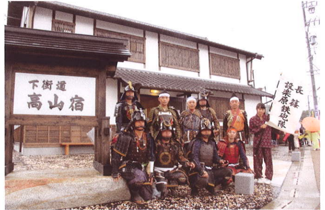
長篠・設楽原鉄砲隊