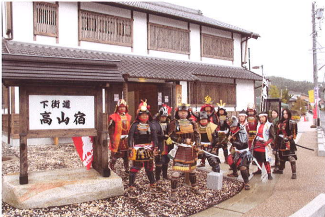
犬山甲冑制作同好会