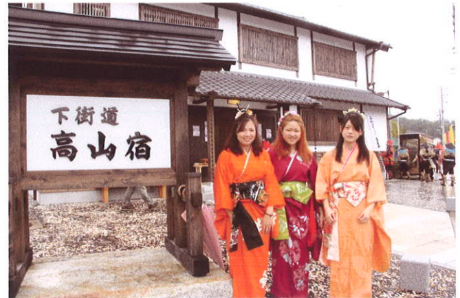
高山城戦国武将隊 女性メンバー