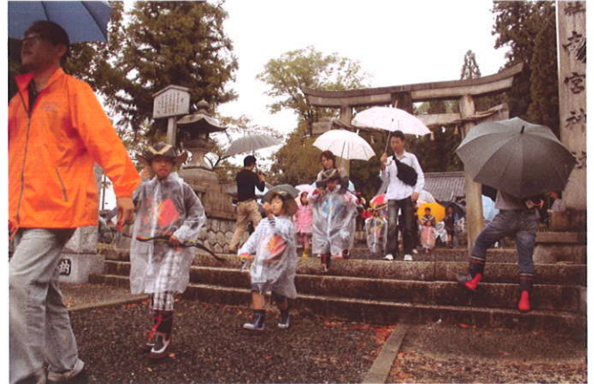
参加した子供たちが武将の後に続く