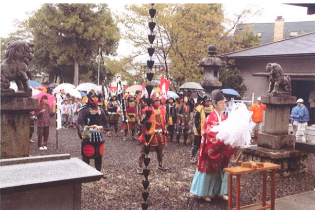
出陣式の様子 (南宮神社)