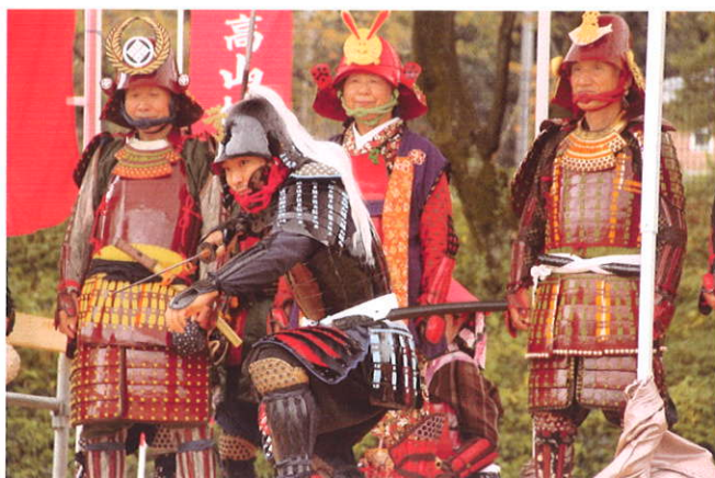
犬山甲冑制作同好会の演武