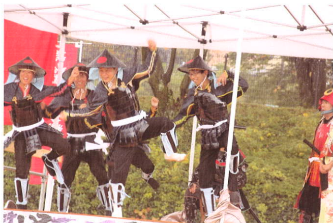
高山城戦国武将隊 足軽のダンス