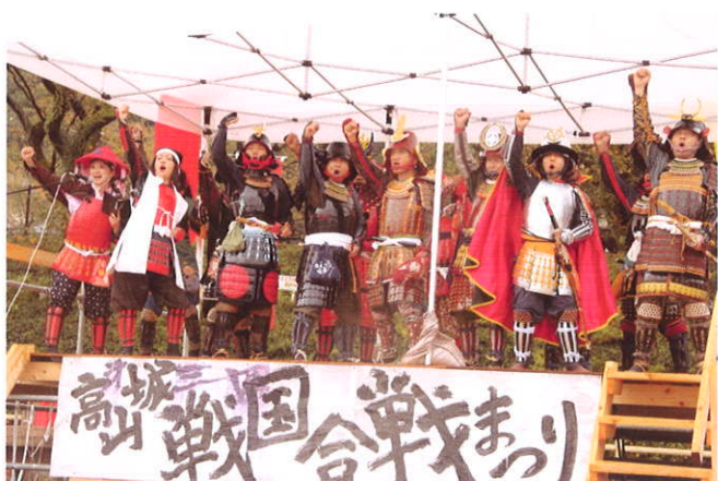
勝鬨を上げる犬山甲冑制作同好会