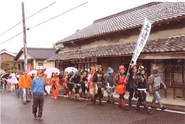
下街道高山宿を練り歩く武者行列