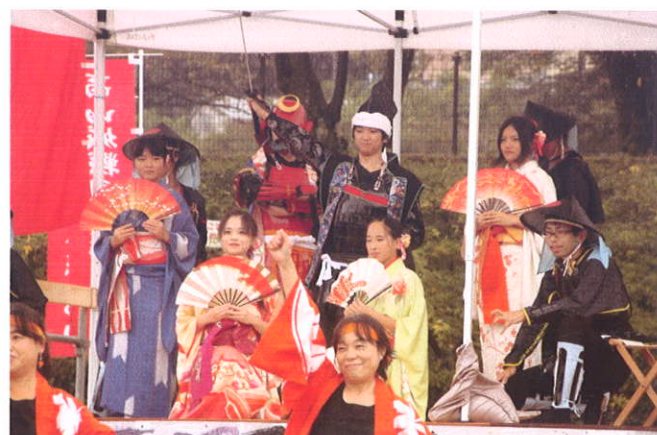
高山城戦国武将隊 姫たちの踊り