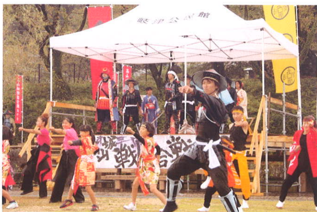
高山城戦国武将隊の演武 子供たちも参加