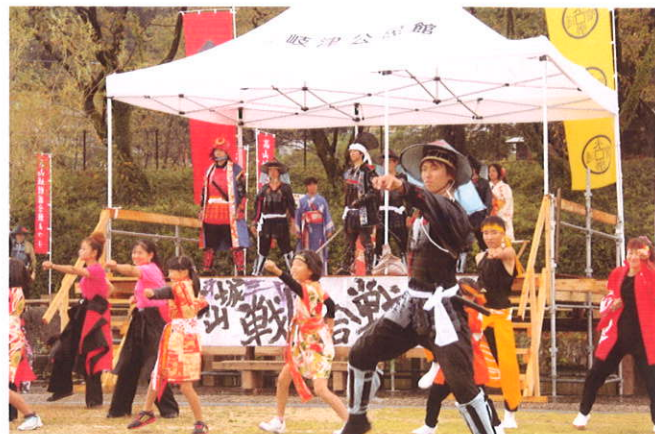
高山城戦国武将隊の演武