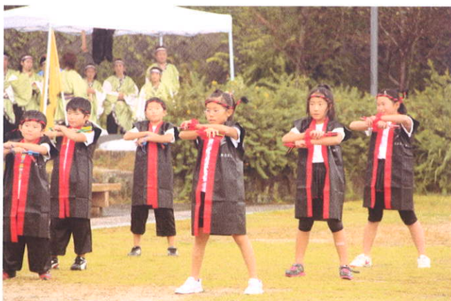
戦国バサラ 子供チーム