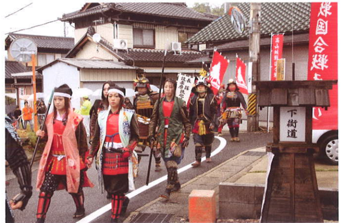
街道を進む武者行列