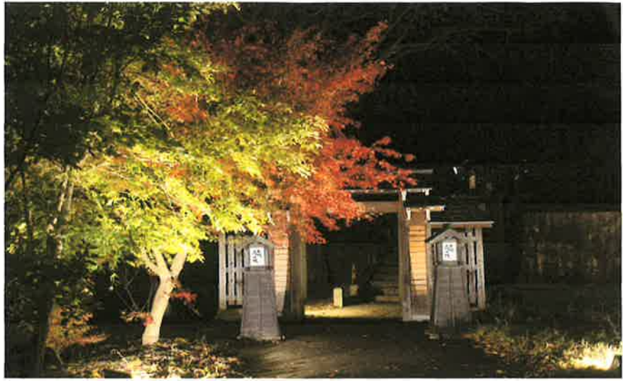
高山城址公園物見櫓ライトアップ