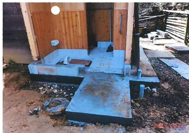
改修中(入口床コンクリート張)