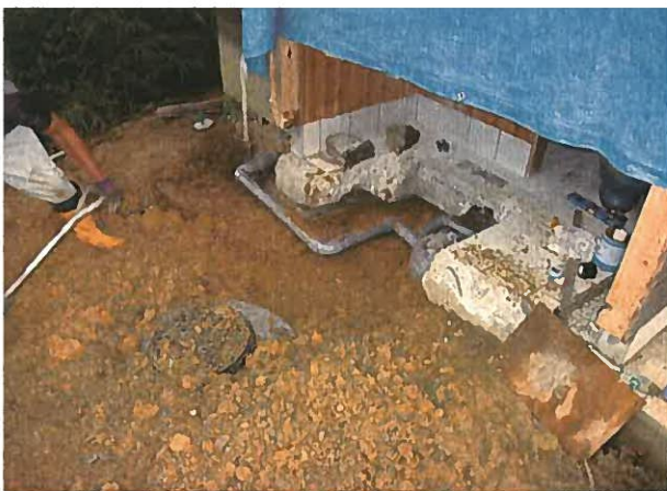
改修後（便槽埋戻し、給水配管設置）