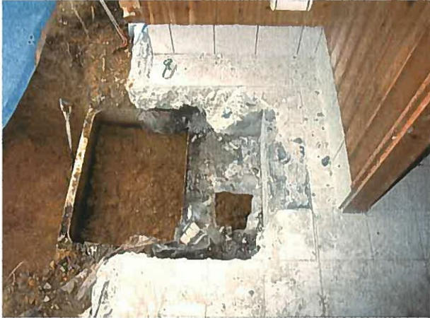
便槽設置工事（改修前）