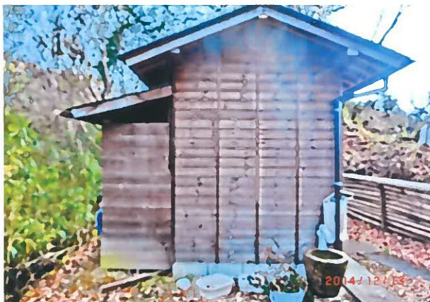
トイレ入り口増設