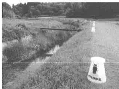
新陽カントリー付近