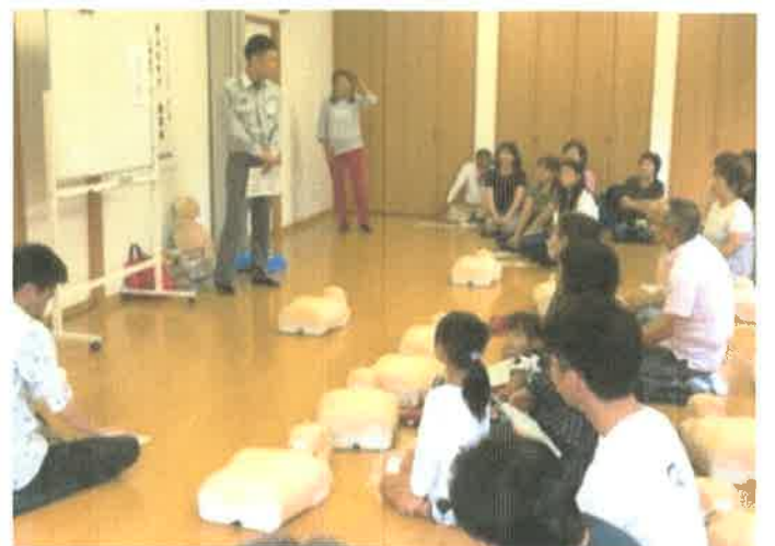
10月18日 第2回 救命救急講習開催 フラワー倶楽部にて