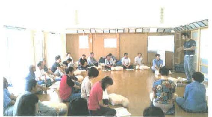
6月12日 第1回 救命救急講習開催 雨池倶楽部にて