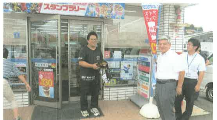
7月27日 コンビニ2店にAED配置