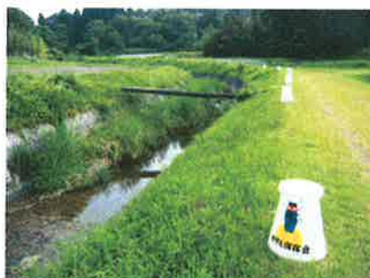
新陽カントリー付近