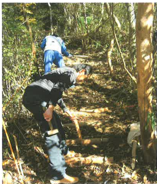
遊歩道階段整備（写真2）