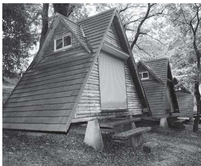
三国山キャンプ場

答弁 新型コロナウイルス感染症対応地方創生臨時交付金事業の執行状況に応じ、一般財源の充当額は抑制されると考える。