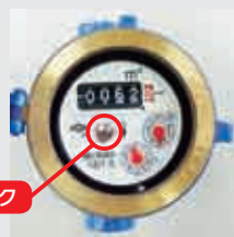
パイロットマーク