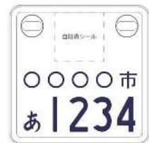
通常の原付よりも小型化！