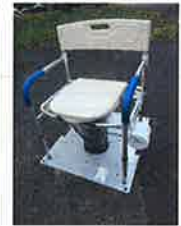
ソフトシート(品番: FGRPC) : 希望小売価格: ¥4,300 + 税