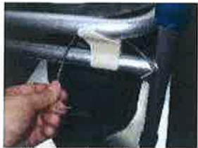
ペーパーホルダーを引っかけます。

ペーパーホルダーの形を整え、ペーパーをセットします。スリーブをマンホール内に挿入し、ねじれ等がないか確認します。