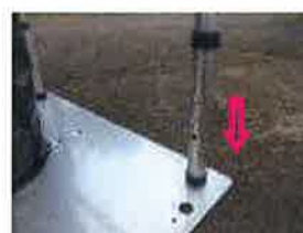
4本のソケットに脚を合わせて均等に押し込む

マンホールカバーの4ヶ所のソケットとフレームの脚を合わせて押し込みます。ソケットが緩んでいる(遊びがある)状態で差し込んでください。ソケットは左に回すと緩みます。