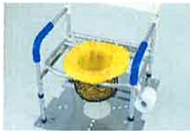
便袋(市販品)セット状態