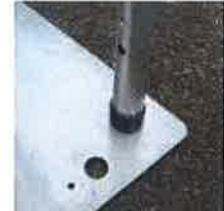
完全に差し込んだ状態