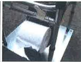
ペーパーホルダーを広げロールペーパーの芯左右にかけます。