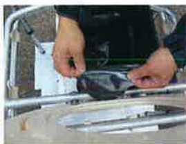
幅の狭い方を後側

スリーブを広げ、ピラの幅が狭い方を便座後ろ側、広い方を前側のパイプに、左右のピラを便座フレームに、面ファスナーを合わせて取り付けます。