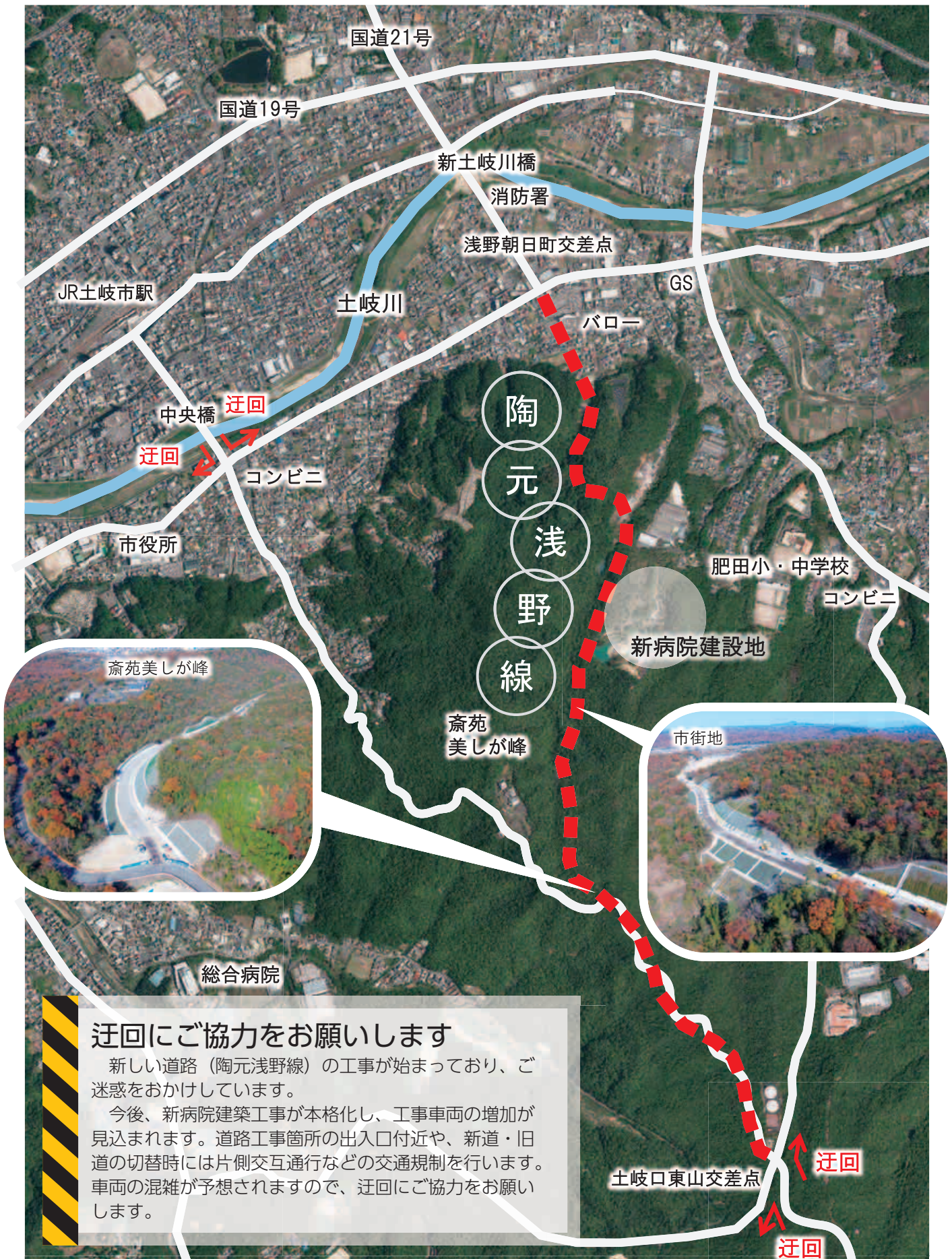
図 土木課 (内線562)