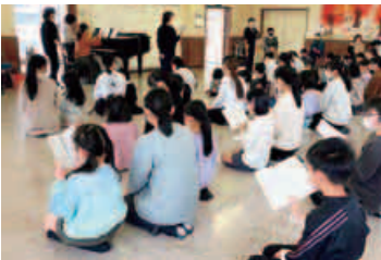
楽譜をじっくり見て 音取りしよう！