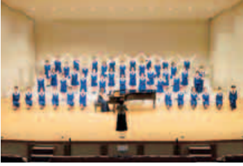
第51回定期演奏会(クラシック)