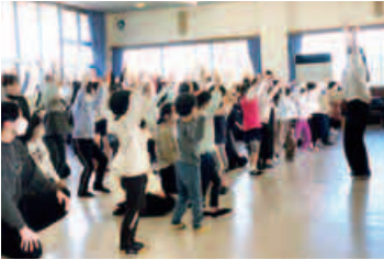
楽しいチビっ子レッスン！