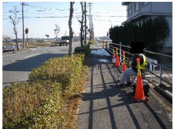
交通量調査のイメージ