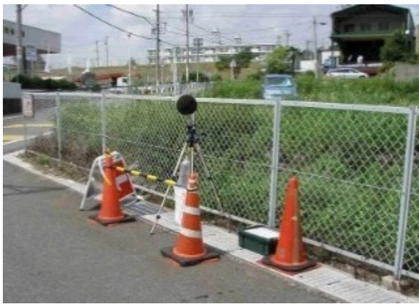
騒音・振動調査のイメージ