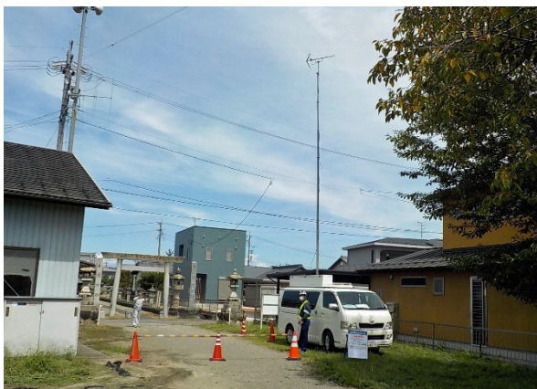
電波障害調査のイメージ