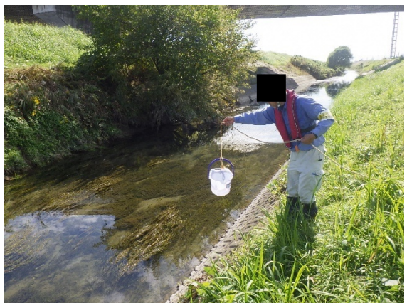
水質調査のイメージ