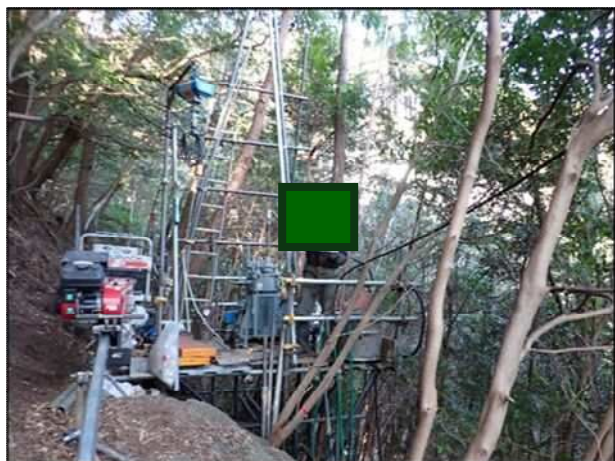
ボーリング作業の様子