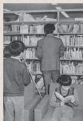
右 文化会館で行われていた成人式（昭和51年） 左 昔は図書館だった美濃陶磁歴史館の展示室 （昭和50年）