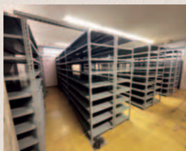
空になった収蔵庫

5月から継続中の移転の動 きは、8月いっぱいであろうや く完了となりました。梱包が 済んだ資料から順次、仮保管 場所へ移され、ぎっしり詰 まっていた収蔵庫が空っぽに なっていく様子は、すがすが しくもあり、寂しくもありま す。そして、9月から、旧文 化会館と美濃陶磁歴史館の解 体工事が始まりました。 2つの施設の歴史を振り返 ると、昭和47年に文化会館が、 昭和54年に美濃陶磁歴史館が 開館しました。文化会館では、 市民音楽祭や美術展、成人式 などが催され、文化活動の拠 点として市民に親しまれてま した。そして、美濃陶磁歴史館