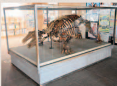
市役所に展示された様子