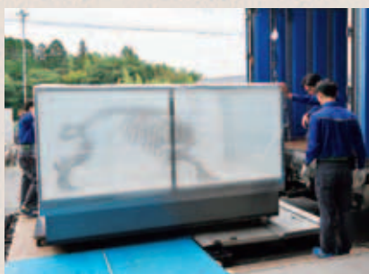
トラックに載せられるレプリカ