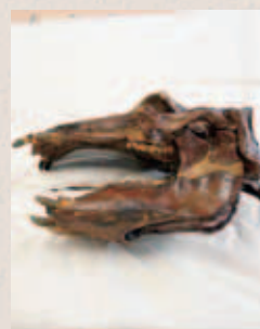
取り外された頭部

6月号で紹介した隠居山出土の化石「パレオパラドキシア・タバタイ」の続報です。この化石は昭和25年に発見されました。世界的に貴重な発見だったことから、現物は研究のため東京へ送られ、代わりにレプリカが昭和49年に東京の国立科学博物館から土岐市へやってきました。