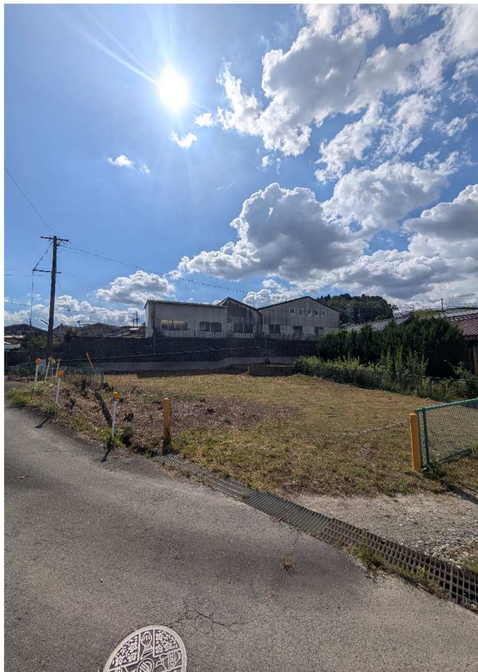
南東方向から撮影