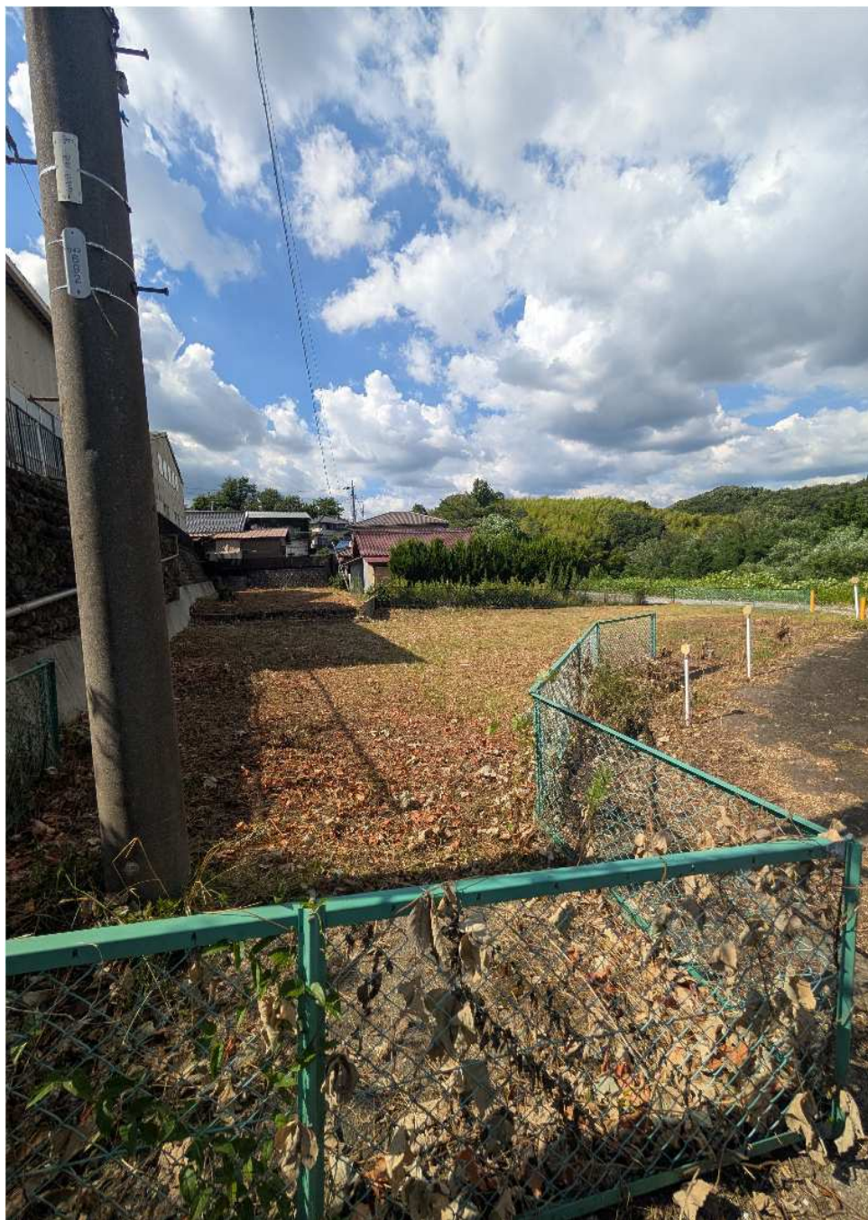
南西方向から撮影