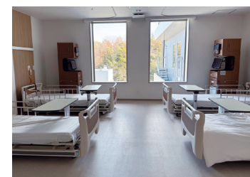
● 病室 (4人部屋)