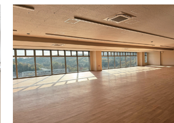
● リハビリテーションセンター