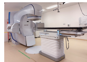
● 放射線治療 バリアンEdge