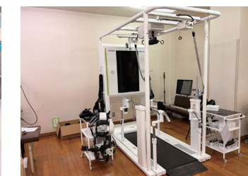
● リハビリ支援ロボット ウエルウォークWW-2000 岐阜県内初導入