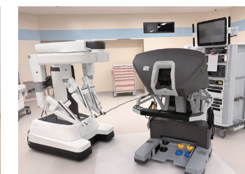
● 手術支援ロボット ダヴィンチ