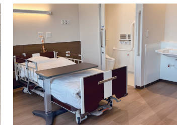
● 病室 (特室)