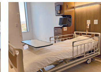
● 病室 (個室)