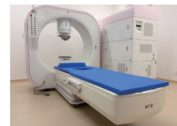
● 高周波式がん温熱治療装置 ハイパーサーミア アウクーフ8