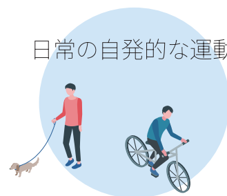
日常の自発的な運動