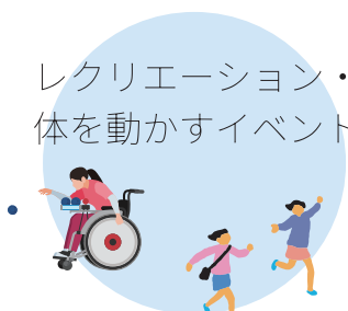
レクリエーション・体を動かすイベント